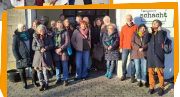
Exkursion zur Importorganisation GLOBO in Beckedorf 2024