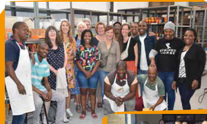
Besuch beim Handelspartner ISUNA in Südafrika 2022