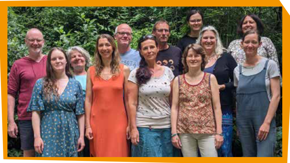
Die Fair-Handels-Berater:innen bei ihrem Treffen im Sommer 2023